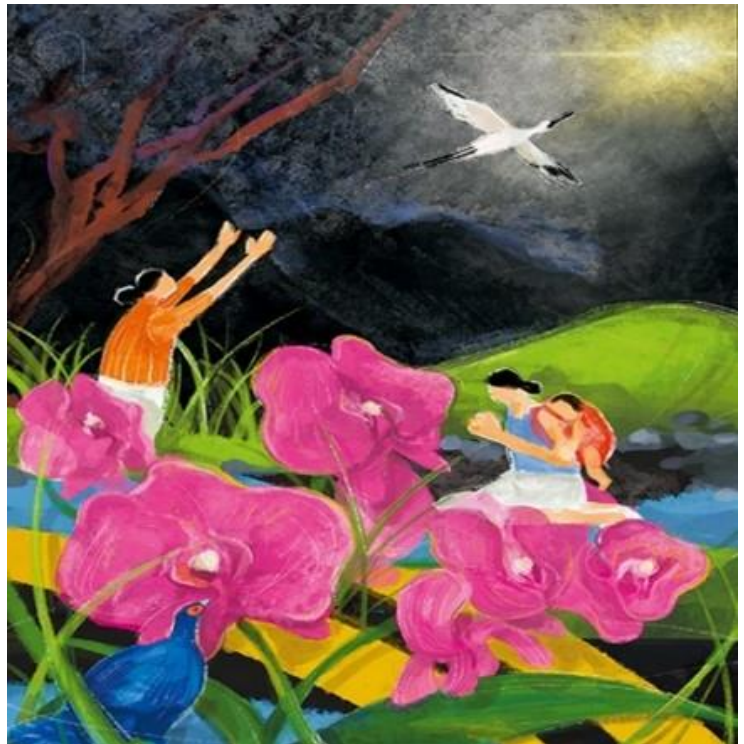
Titelbild „I Have Heard About Your Faith“ von der jungen taiwanischen Illustratorin Hui-Wen Hsiao

„Jesus fastete vierzig Tage und wurde in Versuchung geführt.“