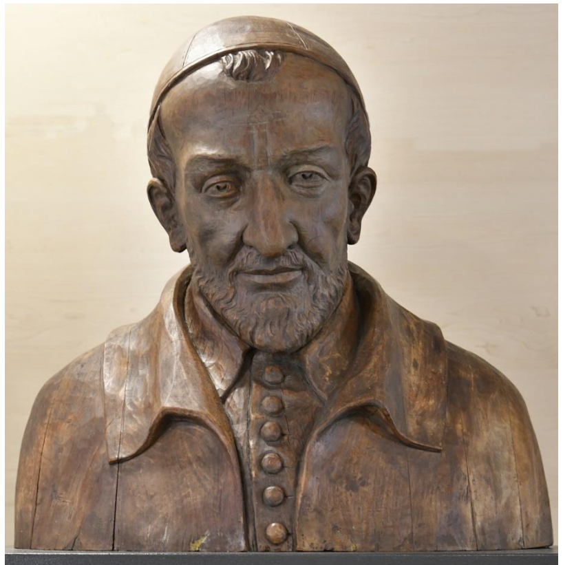
Vinzenz von Paul, Büste Vinzenz-Krankenhaus