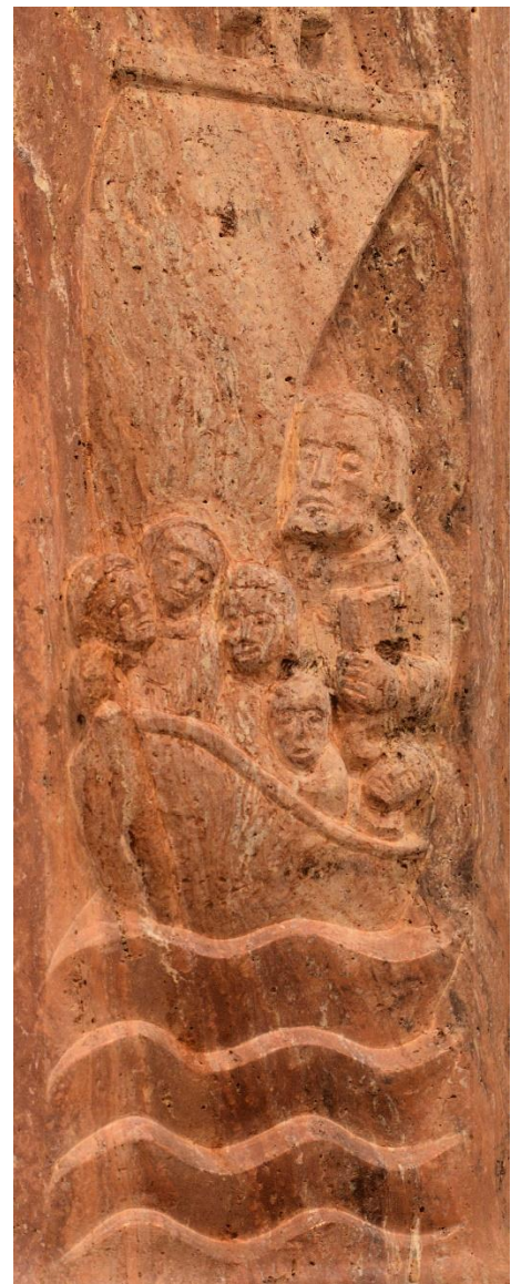
Relief am Ambo, Kapelle Mutterhaus Schwestern der Christlichen Liebe Paderborn