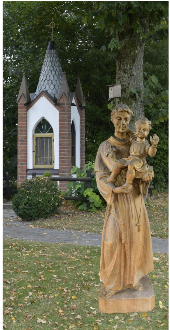
Antonius von Padua, Bildstock Schwaney

„Das kleinste von allen Samenkörnern geht auf und wird größer als alle anderen Gewächse.“