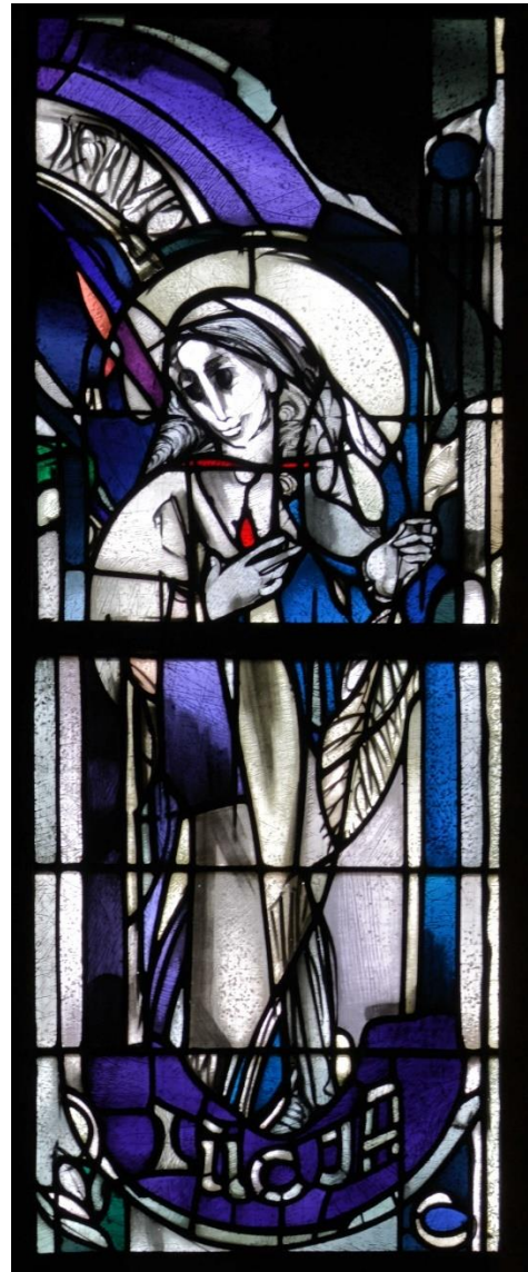
Hl. Lucia, Dom zu Paderborn