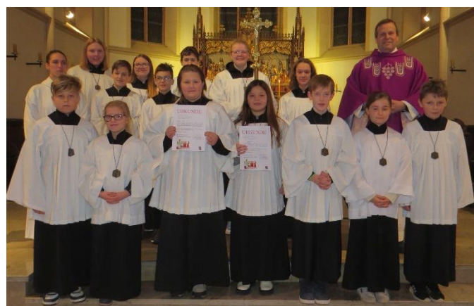
Messdienerneinführung in St. Martin

Die Messdienergemeinschaften in unseren Gemeinden wachsen weiter! Auch Bad Lippspringe durfte am 1. Advent sieben neue Messdiener*innen für die Gemeinden St. Martin und St. Marien in den Dienst der Ministranten aufnehmen. In der Vorabendmesse erhielten sie die Plakette und die Urkunde zur Aufnahme. Alle anderen anwesenden Messdiener*innen gratulierten mit Handschlag und der Stolz der "Neuen" war deutlich in Augen und Gesichtern erkennbar. - Wir freuen uns, dass ihr alle da seid und mit uns Kirche seid!