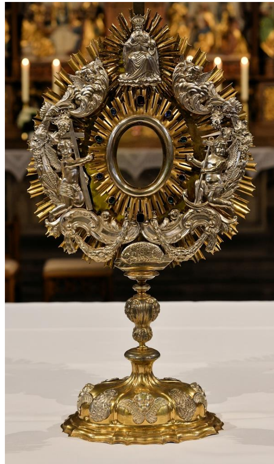
Monstranz St. Martin Bad Lippspringe

„Gott hat seinen Sohn gesandt, damit die Welt durch ihn gerettet wird.“