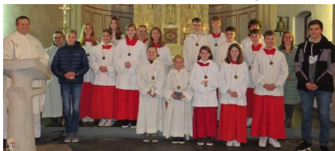
Messdieneraufnahme in St. Dionysius Buke