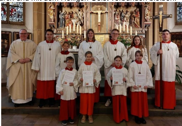
Messdieneraufnahme in Heilig Kreuz Altenbeken

In gleichen Gottesdiensten wurden Ehrungen und Verabschiedungen älterer Messdiener*innen vorgenommen - euch allen danken wir für euer Engagement in den letzten Jahren und wünschen euch und uns, dass wir weiter durch und mit dem Heiligen Geist verbunden bleiben!