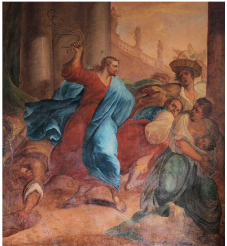
Kloster St. Engelberg, Schweiz

„Reißt diesen Tempel nieder und in drei Tagen werde ich ihn wieder aufbauen.“